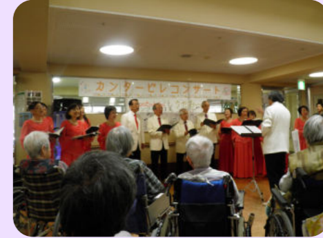
地域交流 (コンサート)