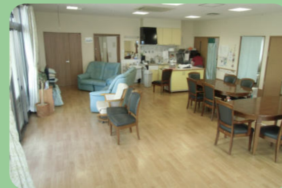
開放感あふれるダイルーム

ぬくもりある家庭的な雰囲気を大事にして、一日ゆったりと安心して過ごしていただける雰囲気・空間作りを心掛けています。個別対応を行い、寄り添ったケアを行います。