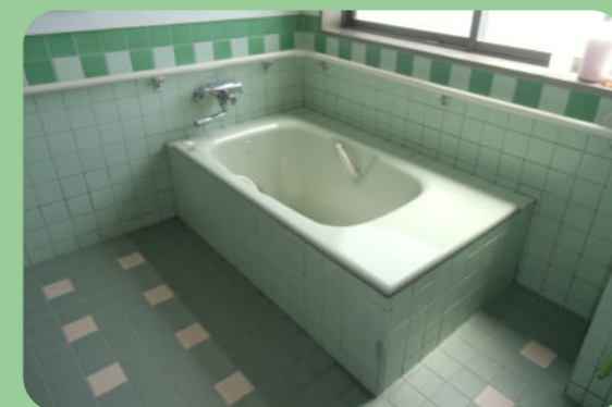
のんびり個浴で入れます