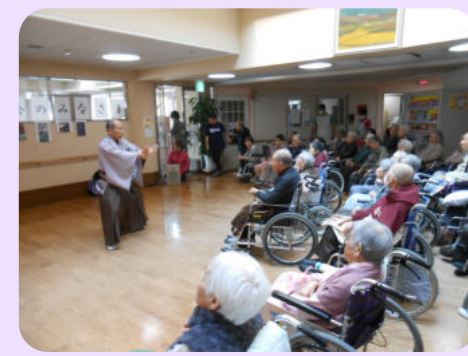
地域交流 (日本舞踊)