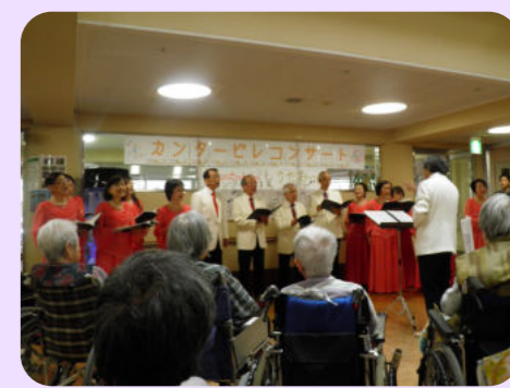
地域交流 (コンサート)